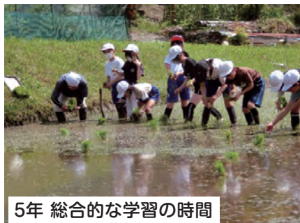
5年 総合的な学習の時間

2年生の地域たんけんでは、深見諏訪神社について、地域の方に教えていただきました。