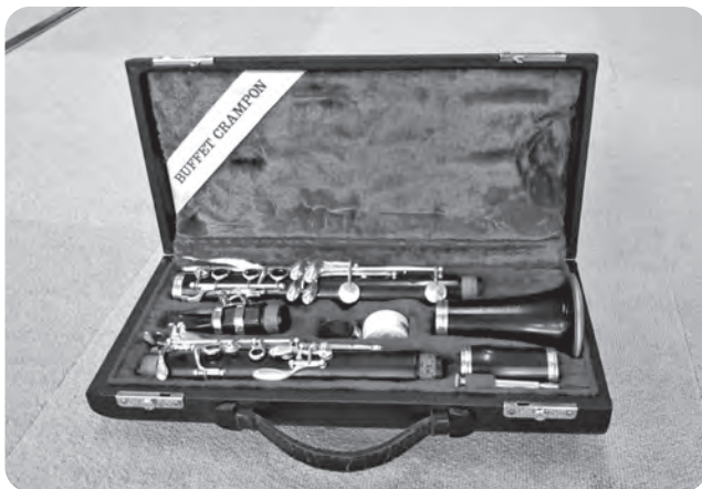
阿南第一中学校 音楽備品(クラリネット)

令和5年度は基金から、3,500,000円を活用し、「福祉、ふるさとの教育、少子化対策等に関する事業」として老人福祉祭り、町内の小中学校の遊具・備品購入事業に活用させていただきました。