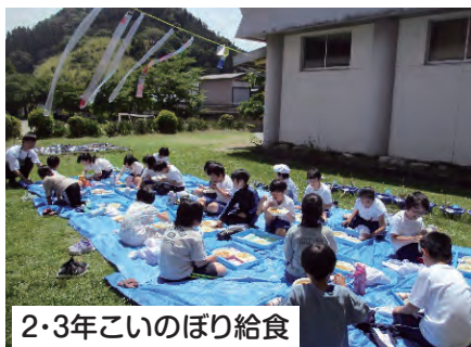
2・3年こいのぼり給食

学校のプールが使えなくなったため、昨年度からB&Gプールで水泳学習を行っています。