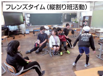
フレンスタイム(縦割り班活動)

フレンスタイムでは、学年縦割りで遊びます。6年生が毎回、楽しい遊びを考えています。