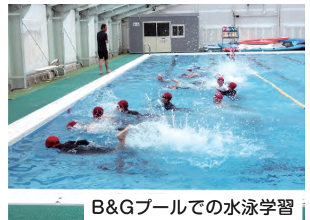
B&Gプールでの水泳学習

地域の方に教わりながら、今年も5年生が米づくりをしました。代かきや田植え等、体験しました。